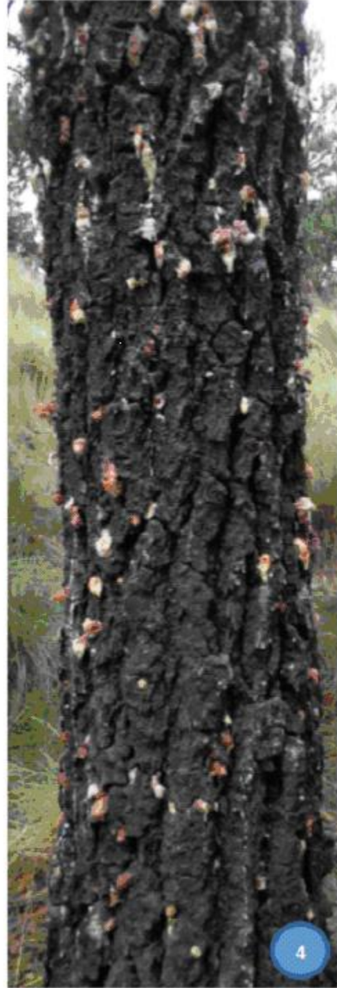
Fotografías 1, 2, 3 y 4. Presencia de grumos de resina, de color blanco y rojizo sobre el fuste del arbolado. Estos grumos también pueden encontrarse sobre ramas