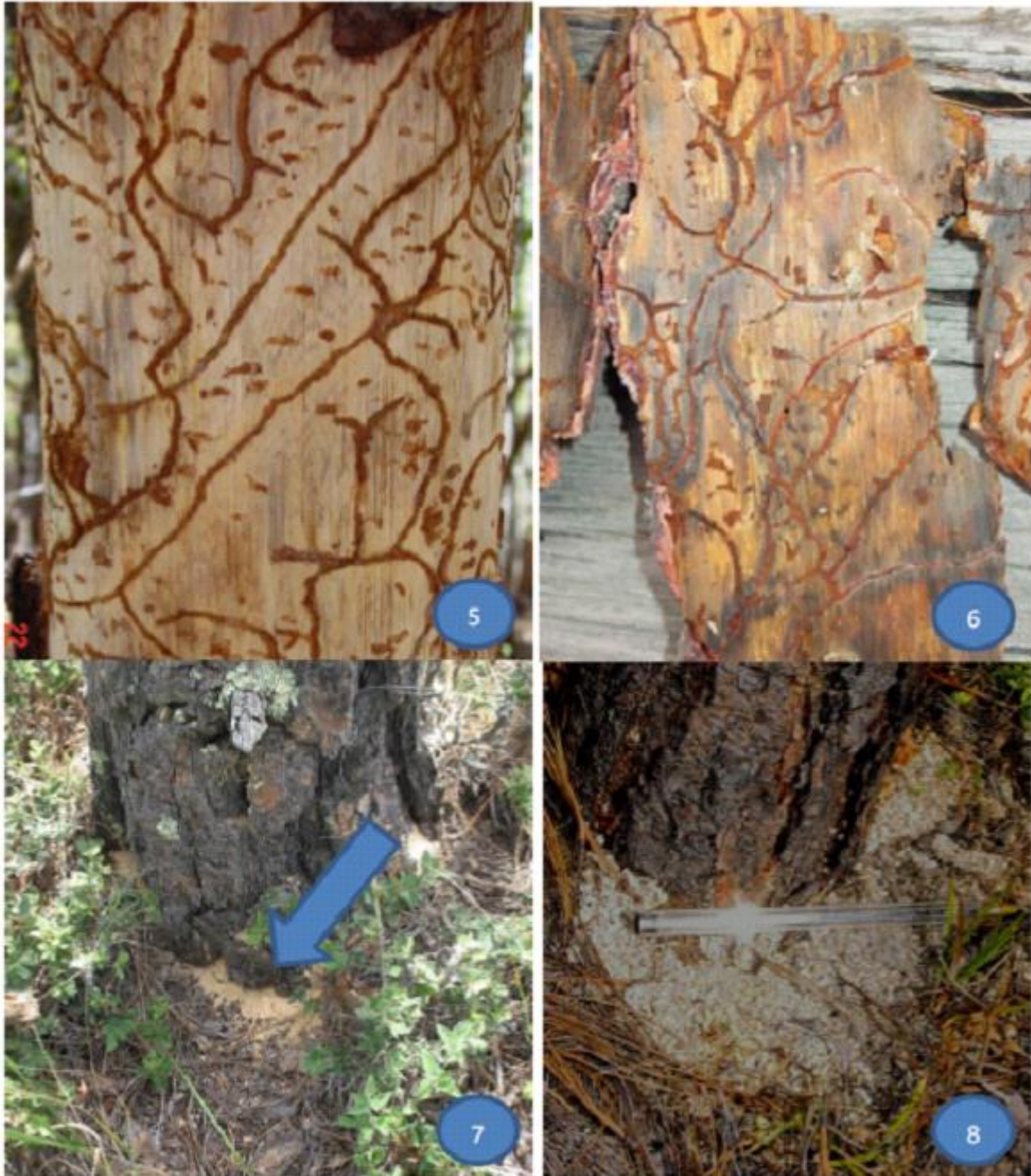
Fotografía 5.- Galerías por descortezadores en la zona del cambium. 6.- Corteza desprendida, sobre su interior también se aprecian las galerías. Fotografías 7 y 8.- Sobre la base del fuste del arbolado infestado, se aprecian gránulos de resina cristalizada.