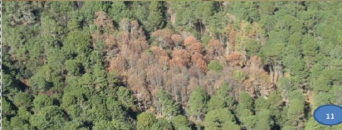
Fotografías 9 y 10.- Coloraciones de copa del arbolado afectado por descortezadores, Las coloraciones se pueden tornar verde amarillento hasta café rojizo. Foto 11.- Brote de infestación por descortezadores, tomada desde el aire, se puede apreciar la coloración café, rojiza y rojo.