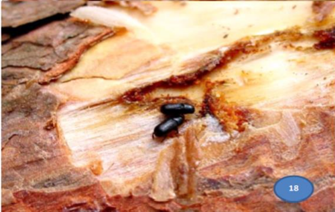
Fotografía 17 y 18.- Adulto, última etapa de desarrollo del descortezador, de cuerpo robusto con coloración café claro a café oscuro, de diferentes tamaños dependiendo la especie, el cual puede ir de 2.2 a 9.0 mm