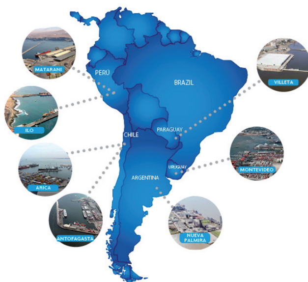
Mapa 1. Vías de ingreso y salida de comercio exterior de Bolivia

1 y Cuadros 4 y 5). Cabe notar que el transporte aéreo es viable únicamente para determinadas mercancías con precio elevado, poco volumen y peso reducido.